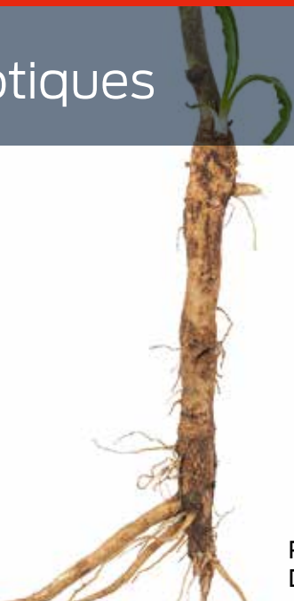
RACINES DE CHICORÉE